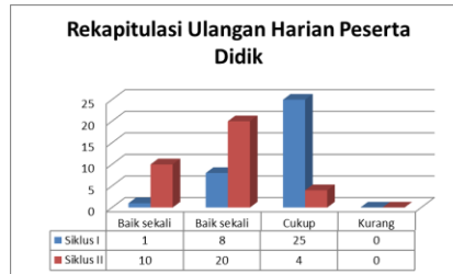
Gambar 2. Grafik Rekapitulasi Nilai UH Peserta Didik

Peningkatan hasil belajar peserta didik pada siklus II dibandingkan dengan nilai rata-rata peserta didik pada siklus I dapat ditentukan menggunakan rumus berikut: