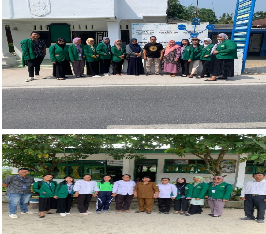
Gambar 1. Poto Kegiatan

serta laksanakan dalam kegiatan KKN telah melalui proses observasi dan survei sesuai dengan kebutuhan dan kemampuan mahasiswa dalam melaksanakannya.