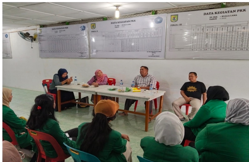
Gambar 3. Foto Kegiatan Dengan Masyarakat