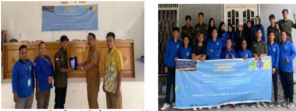
Gambar 2. Dokumentasi Kegiatan Di Desa Gunung Selamat