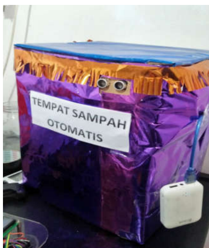
Gambar 2. Hasil Simulasi Tong Sampah Pintar

Perancangan mekanikal meliputi pembuatan kerangka alat :