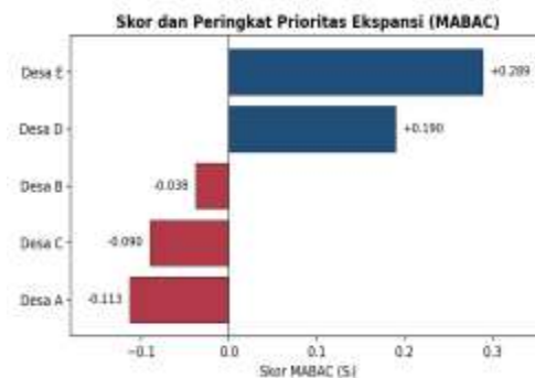
Gambar 1. Skor dan peringkat prioritas ekspansi (MABAC)